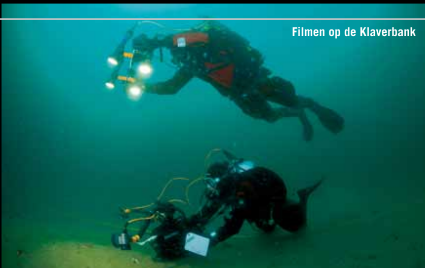
Filmen op de Klaverbank