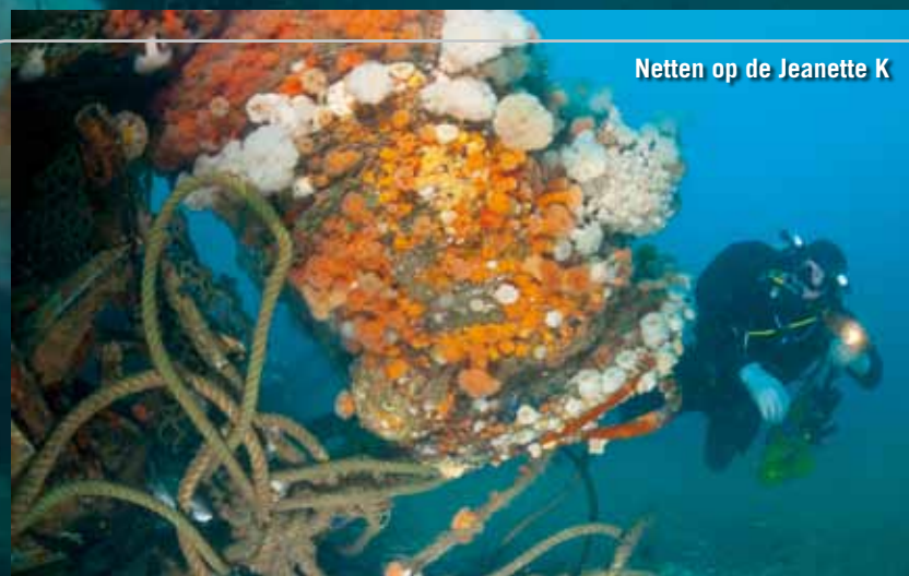
Netten op de Jeanette K

aandacht de haven van Scheveningen binnenvaren, kijken wij voldaan terug op een geslaagde expeditie die de Nederlandse faunasoortenlijst elf nieuwe soorten heeft opgeleverd. □