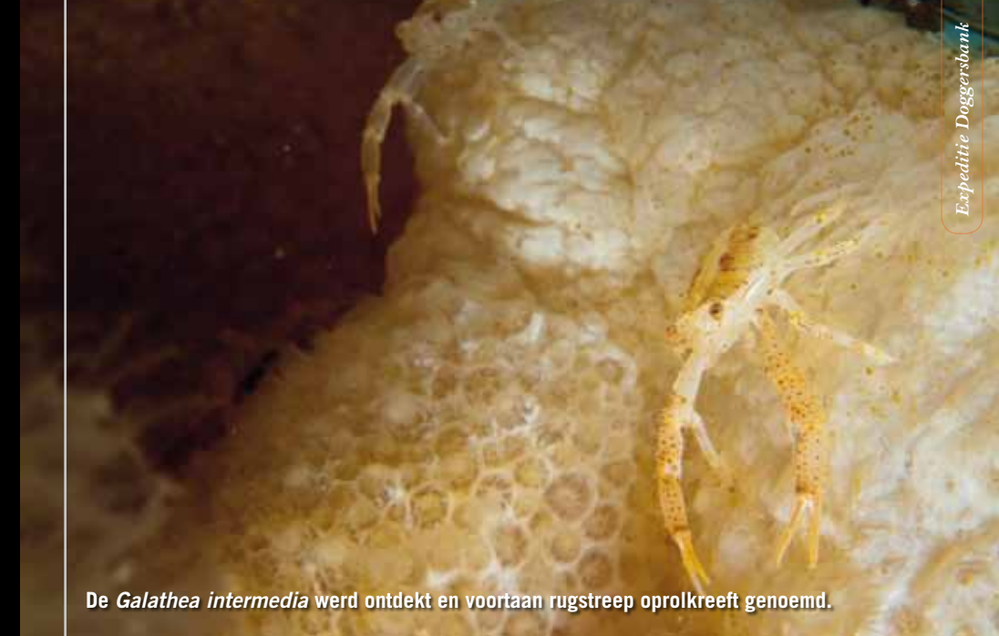
De Galathea intermedia werd ontdekt en voortaan rugstreep oprolkreeft genoemd.

Als we na de eerste nacht aan boord wakker worden, varen we langs de Zeeuwse kust. We zijn onderweg naar de drie kruisers, een drietal Engelse slagschepen dat verging tijdens de Eerste Wereldoorlog. De drie kruisers lagen dicht bij elkaar toen ze door de Duitse onderzeeër U-9 te grazen werden genomen. Nadat het eerste schip werd geraakt, werd een deel van de opvarenden gered en zij stapten over op het tweede schip, maar helaas bleek dat ook niet veilig, binnen een uur zonk ook dit schip. Wederom wist een deel van de bemanning te ontkomen en zij gingen aan boord van de derde kruiser, maar helaas bood ook