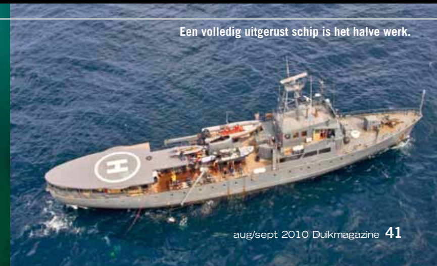
Een volledig uitgerust schip is het halve werk.