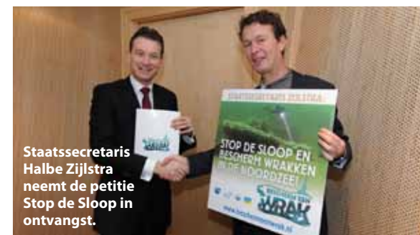
Staatssecretaris Halbe Zijlstra neemt de petitie Stop de Slooper in ontvangst.

sport vissers en duikers) en uiteraard aan de controle en handhaving. Aan de KLPD in Nederland wordt gevraagd om bij een tip poolshoogte te nemen. En een goede controle bij aankomst in de haven op illegaal koper en brons, en het indien nodig opmaken van een proces verbaal. De demonstratiewrakken moeten regelmatig geïnspecteerd worden door duikers, en indien nodig, moeten zij deze schoonmaken. DDNZZ heeft zichzelf tot doel gesteld om 100 wrakken nettenvrij te maken, wat hopelijk in 2013 behaald zal zijn.