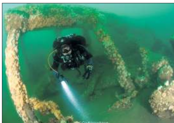
Een duiker baant zich een weg in het karkas van de HMS Aboukir.

Facebook.com/livebaitsquadron beschermeenwrak.nl/kruisers