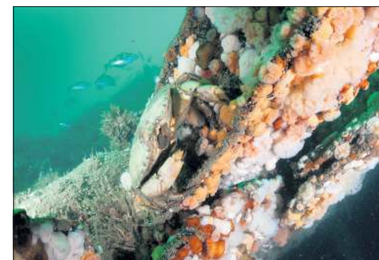
Rijk zeelieven op het wrak van de HMS Aboukir: zeeanemonen, een noord-zeekrab en op de achtergrond steenbolksjes.