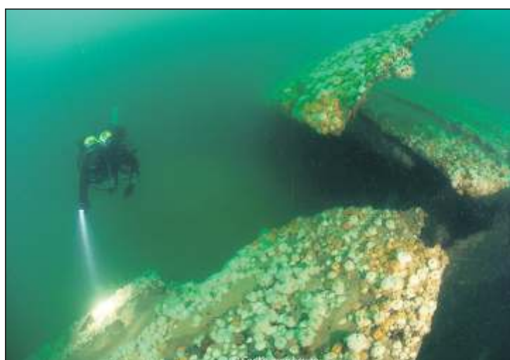
Pantserbeplating van de HMS Aboukir, begroeid met zeeanemonen.