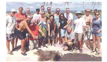
Vrijwilligers van het vislijnenproject