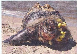
Twee van de schildpadden die in de netten werden aangetroffen

VRIJWILLIGERS Maar terug naar het Bonaireaanse project. Hulp is er ook van de duikcentra die regelmatig duiken organiseren om de troep onder water op te ruimen. Behalve de terugkerende gezamenlijke schoonmaakduiken met vrijwilligers – de laatste keren dat er, gecoördineerd door Dive Friends Bonaire, bij de Town Pier werd gedoken gingen er op die zaterdagochtenden meer dan honderd mannen en