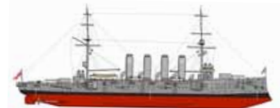
Ter nagedachtenis aan de 1459 omgekomen marinemannen van The Royal Navy.

Stichting Duik de Noordzee schoon erkent dit scheepswrak als zeemansgraf en doet een dringend verzoek om deze rustplaats respectvol te behandelen. Breeveertien, 22 september 2014