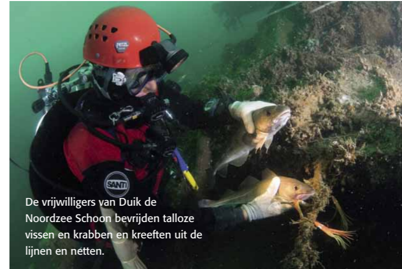
De vrijwilligers van Duik de Noordzee Schoon bevrijden talloze vissen en krabben en kreeften uit de lijnen en netten.