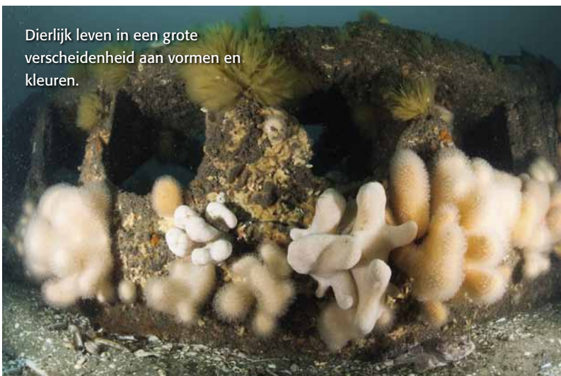
Dierlijk leven in een grote verscheidenheid aan vormen en kleuren.

Bijeenkomst van alle bij dit bijzondere project betrokken 'stakeholders'.