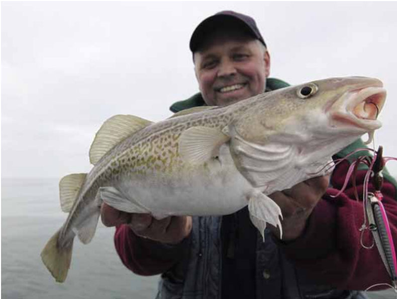
Sportvissers willen de vissen die rond het wrak verblijven graag vangen...

hebben" zegt Breve van Sportvisserij Nederland. "Daarom wordt naar alternatieven gezocht voor vislood, zowel voor zoet als zout water. We hebben binnen het Innovatieprogramma van de Kader Richtlijn Water een proef gedaan, waarin we een aantal varianten als vervanger voor lood hebben ontwikkeld en hier diverse groepen sportvissers en hengelsportwinkels mee in aanraking gebracht." Dankzij een bijdrage van Vereniging Kust en Zee konden hengelaars deze alternatieven goedkoper krijgen, want de prijs voor deze alternatieven ligt helaas nog steeds hoger dan lood. Kauffman: "De zoektocht wees uit, dat het vinden van een goede vervanger moeilijk is, zeker als het alternatief ook duurzaam moet zijn, zonder schadelijke stoffen, en