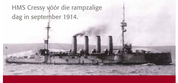
HMS Cressy vóór die rampzalige dag in september 1914.