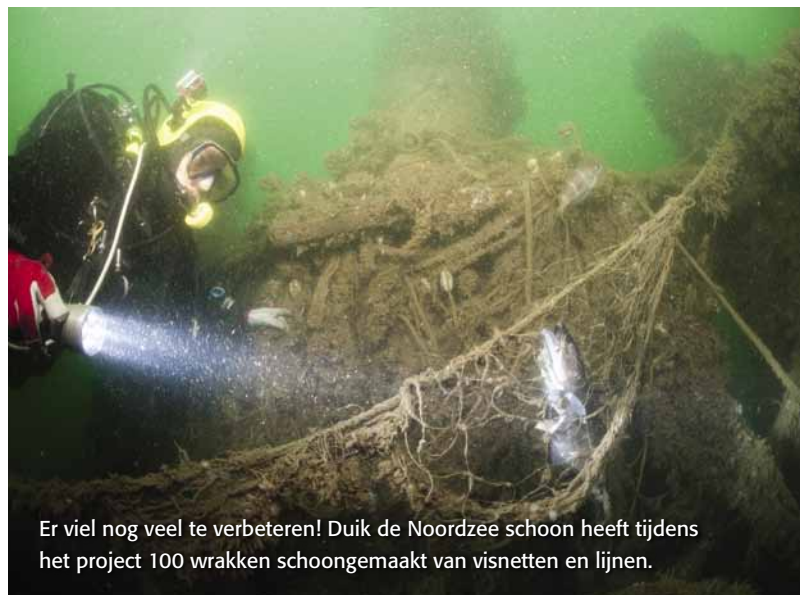
Er viel nog veel te verbeteren! Duik de Noordzee schoon heeft tijdens het project 100 wrakken schoongemaakt van visnetten en lijnen.