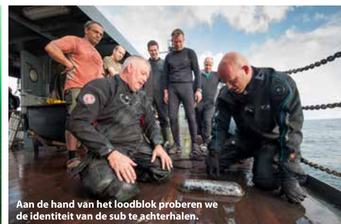
Aan de hand van het loodblok proberen we de identiteit van de sub te achterhalen.