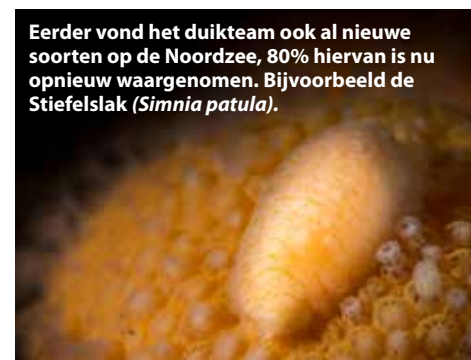
Eerder vond het duikteam ook al nieuwe soorten op de Noordzee, 80% hiervan is nu opnieuw waargenomen. Bijvoorbeeld de Stiefelslak ( Simnia patula ).