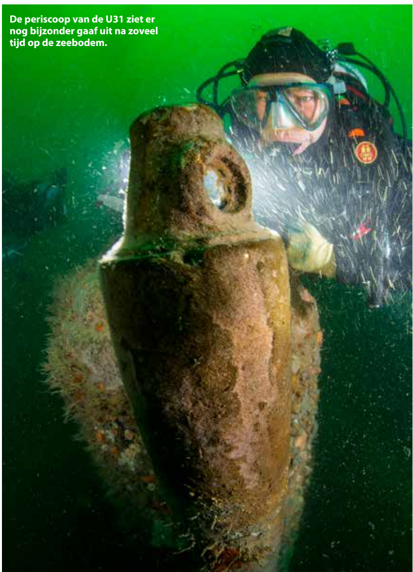
De periscoop van de U31 ziet er nog bijzonder gaaf uit na zoveel tijd op de zeebodem.