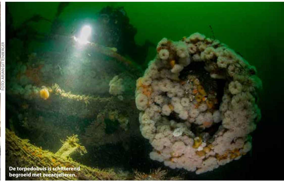
De torpedobuis is schitterend begroeid met zeeanellijeren.

opgelost? We hebben nu haast om op het laatste wrak van deze expeditie te komen en Fred telefoneert met de satelliettelefoon naar de wal om een deskundige te raadplegen. Door de informatie die we vooraf hadden gekregen en het feit dat dit wrak zo compleet is, gaan we nog steeds uit van een U-Boot uit de Tweede Wereldoorlog. Het persbericht moet eruit en behalve de drie nieuwe Nederlandse diersoorten willen we natuurlijk ook deze geweldige vondst delen.