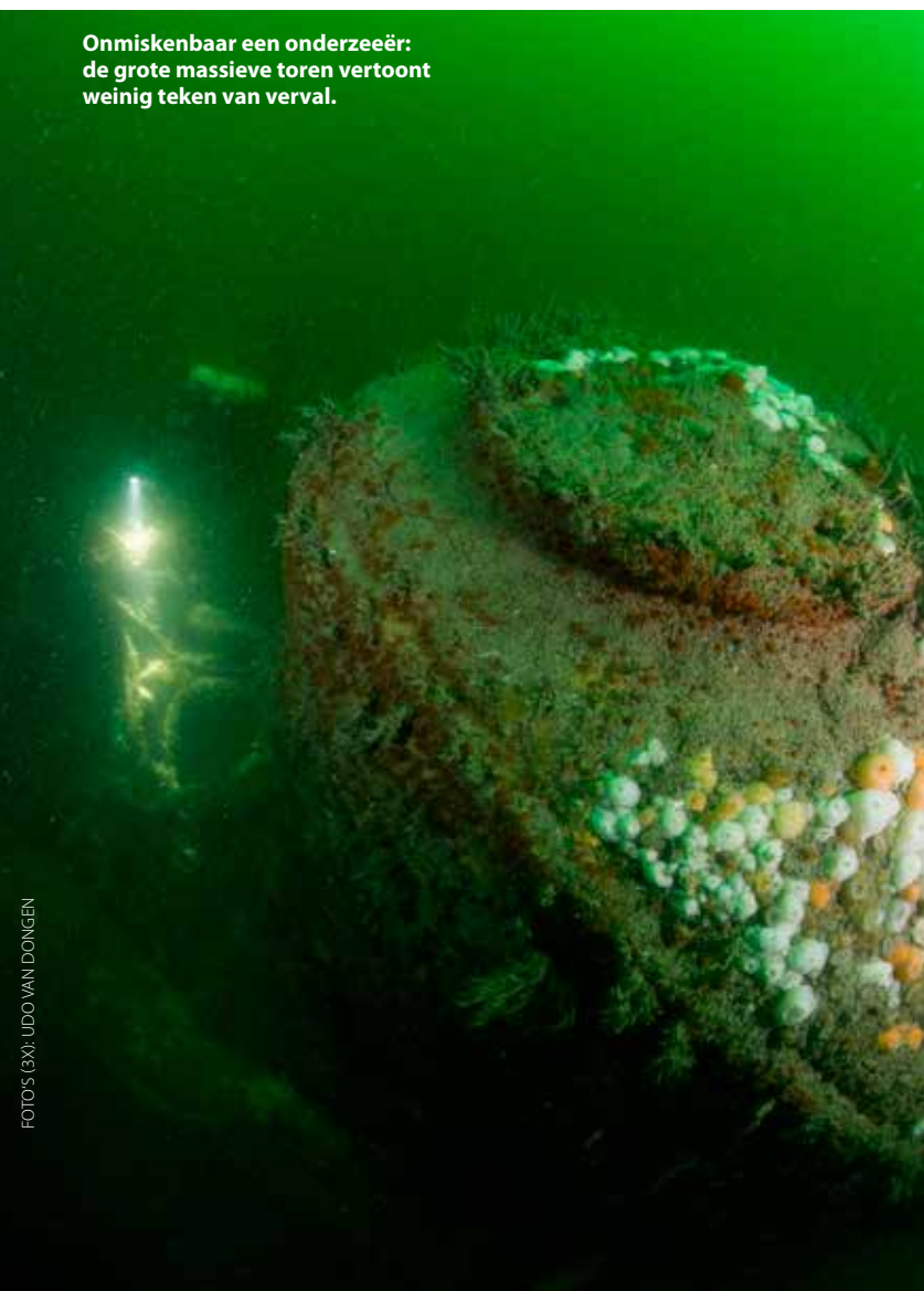
Onmiskenbaar een onderzeeër: de grote massieve toren vertoont weinig teken van verval.