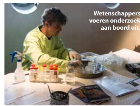
Wetenschappers voeren onderzoek aan boord uit.