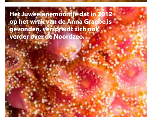
Het Juweelanemoontje dat in 2012 op het wrak van de Anna Graebe is gevonden, verspreidt zich ook verder over de Noordzee.