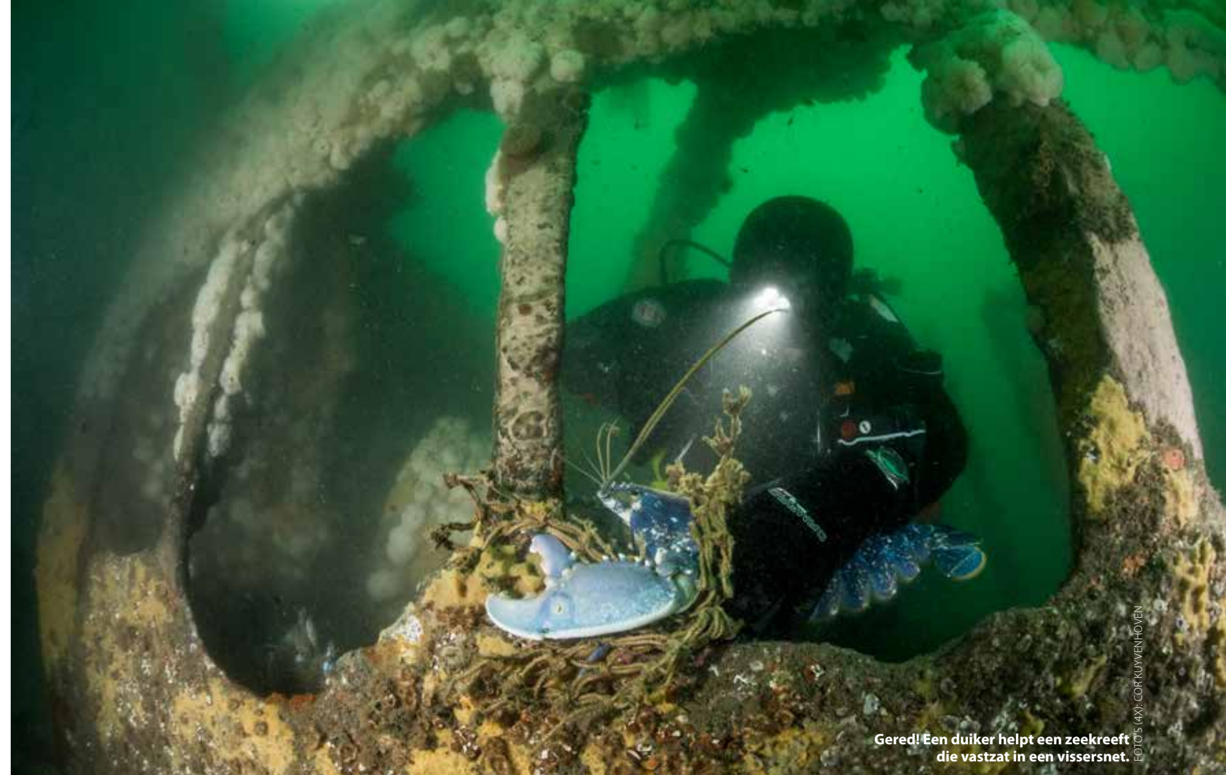
Gered! Een duiker helpt een zeekeef die vastzat in een vissersnet.

zware loodblokken met inscriptie. Deze zijn op de huid vastgezet om deze onderzeeboot in balans te houden. We hebben inmiddels de postzak plichtmatig weer gevuld met netten en lijnen en gooien er een loodblok bij. Straks aan dek kunnen we hiermee de identiteit van dit scheepswrak achterhalen. Het valt me op dat het torenluik met afgebroken scharnier schuin over de ingang ligt. Wat een mooi wrak! Superduik! Zodra alle duikers veilig aan boord zijn, bekijkt Fred Groen het loodblok en we zijn het er snel over eens dat dit een Duitse U-boot is. We besluiten hier nog een duik te maken voor betere foto- en filmopnames. Wat duurt vijf uur wachten lang voordat de nieuwe kentering eraan komt. Eindelijk kunnen we het water weer in en belanden nu aan de achterzijde van het wrak. De schroeven en het roer zitten nog op hun plaats. We beginnen