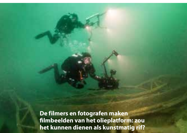
De filmers en fotografen maken filmbeelden van het olieplatform: zou het kunnen dienen als kunstmatig rif?