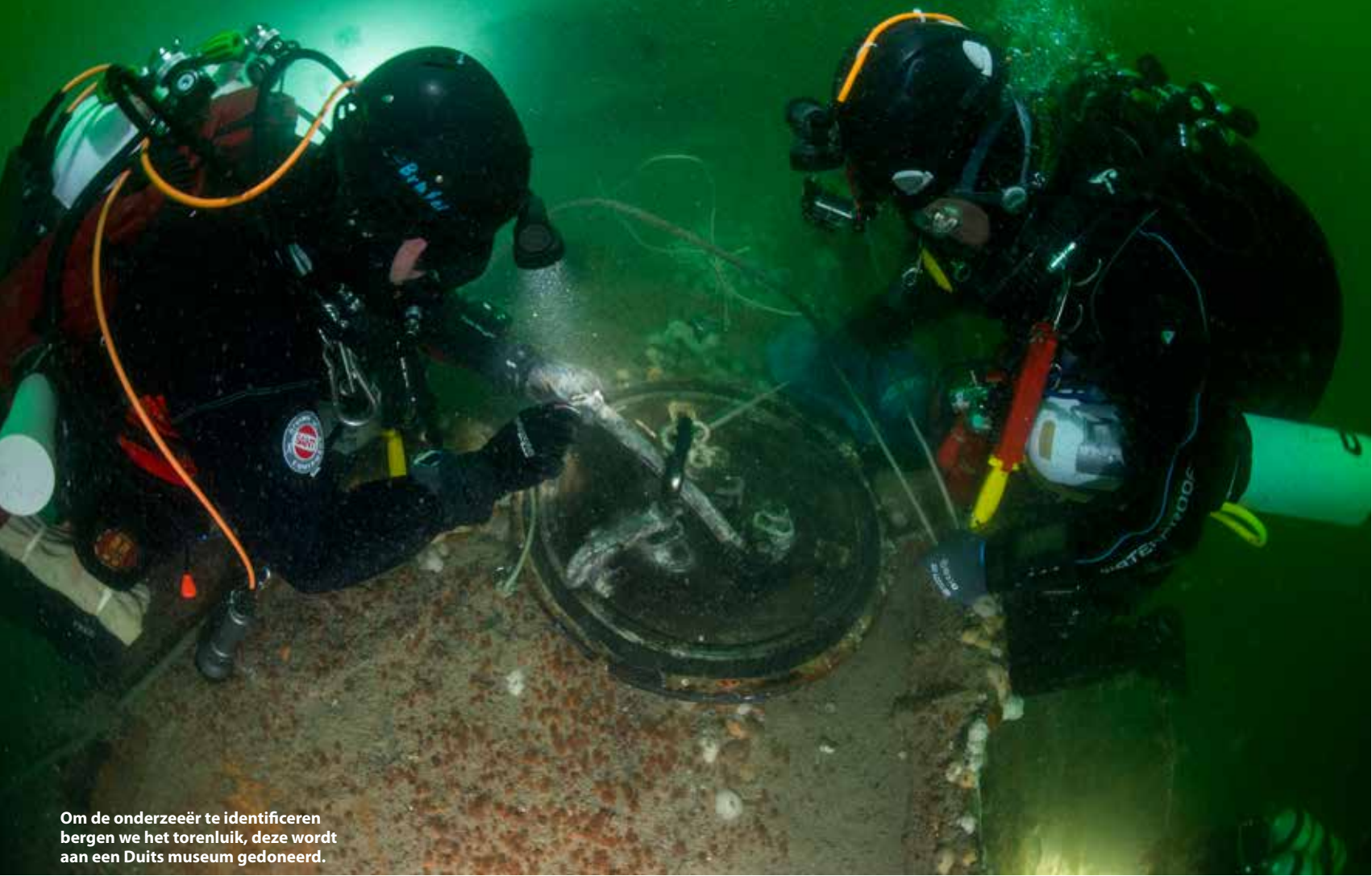
Om de onderzeeër te identificeren bergen we het torenluik, deze wordt aan een Duits museum gedoneerd.