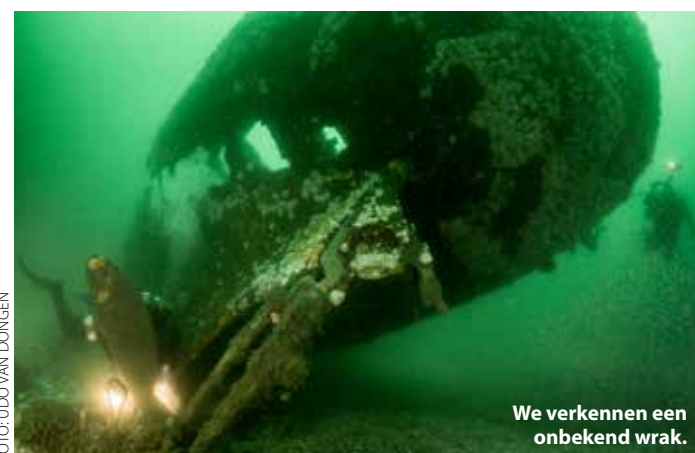
We verkennen een onbekend wrak.