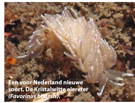
Een voor Nederland nieuwe soort. De Kristalwitte eiereter ( Favorinus blianus ).