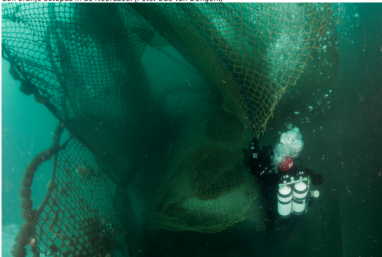
Sommige dieren kwamen vas te zitten in een van de vele visnetten in het gebied. De duikers hebben zesduizend kilo net weggesneden.