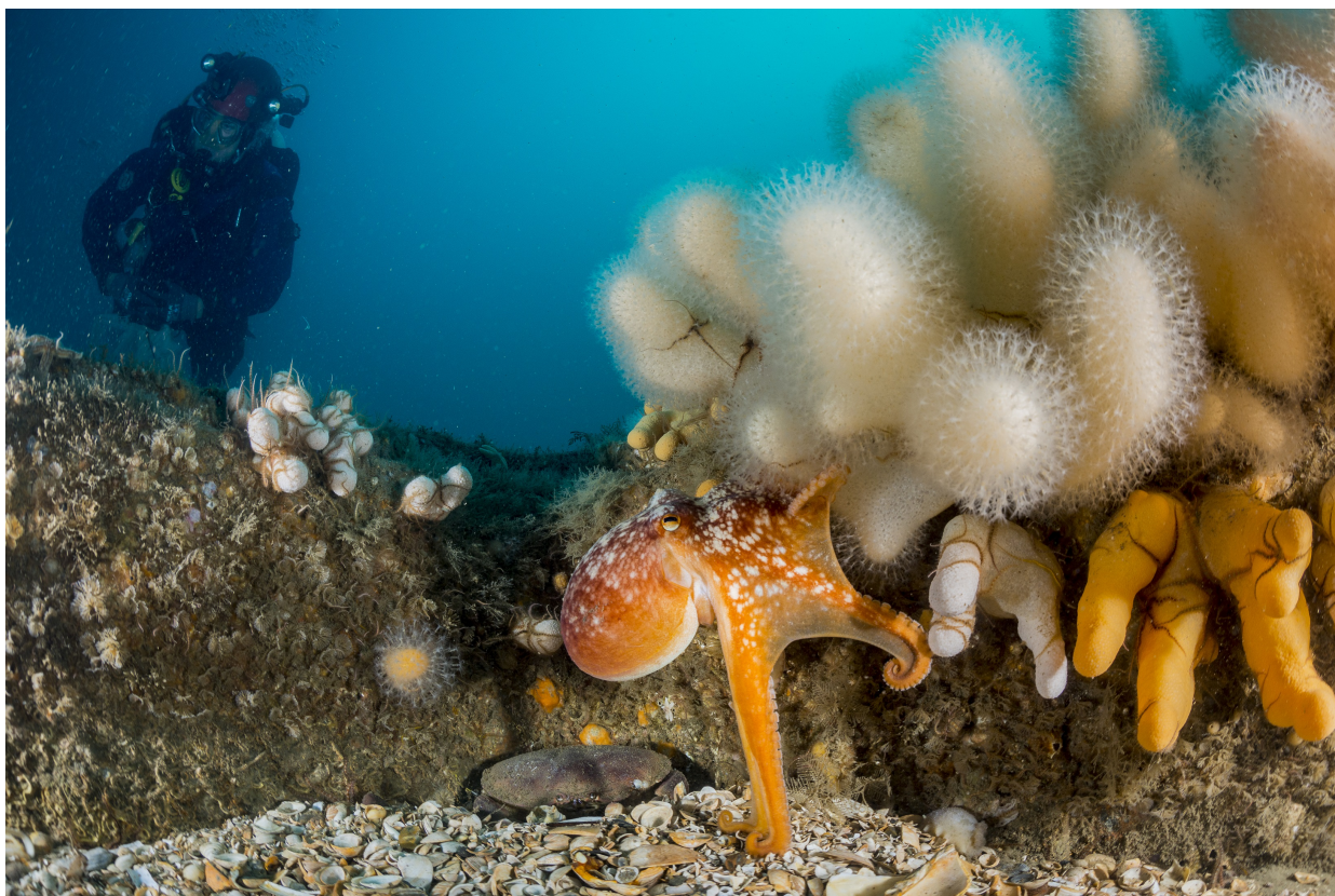
Een oranje octopus in de Noordzee.