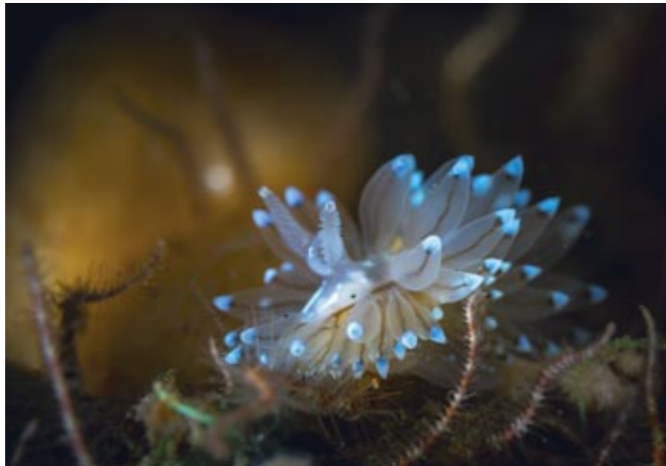
Boven: Blauwtipje. Onder: De Noordzee is groot genoeg om natuur en visserij naast elkaar te laten bestaan.

Ik snijd de Noordseekrab voorzichtig los , want zelfs verzwakte exemplaren hebben scharen om respect voor te hebben.