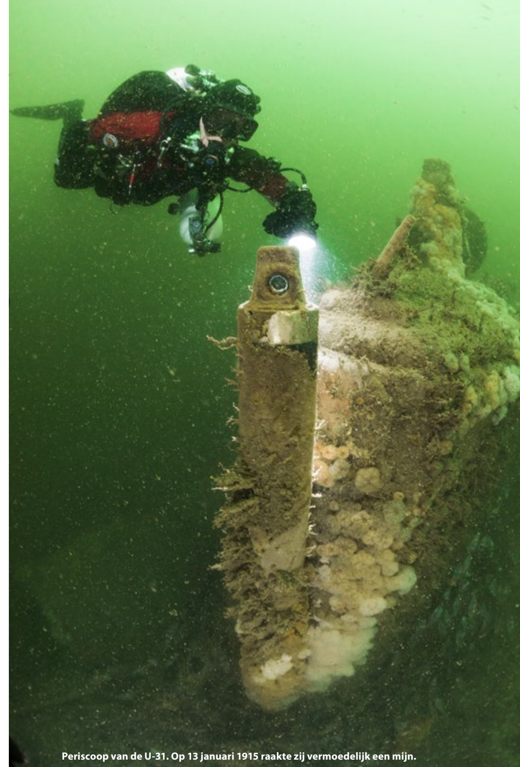
Periscoop van de U-31. Op 13 januari 1915 raakte zij vermoedelijk een mijn.

Net boven de Bruine Bank duiken we op een grote, moderne Russische onderzeeër van de Whiskey-klasse. Deze schepen werden gebouwd om te spioneren in de Noordzee en Atlantische Oceaan. Met een lengte van bijna 90 meter en een hoogte van 5 meter is het een imposant wrak. Na jarenlang haar werk te hebben gedaan, werd ze op 8 juni 1990 versleept van Denemarken naar Glasgow om daar gesloopt te worden. Maar een storm zorgde ervoor dat de sleepkabel brak en dwars op de golven liggend was ze al snel een makkelijke prooi voor het razende water. We hebben geluk met het weer. De Noordzee is spiegelglad en het water is donkerblauw. We verheugen ons op een mooie bergingsduik met het DDNZS-team. We weten dat er aan de achterzijde nog een staand want en dunne sleepnetten hangen. Als het tijdstip van de kentering is aangebroken, spring ik samen met mijn buddy overboord. Bij de afdaallijn kijken we wel 15 meter naar beneden. Op 20 meter diepte zien we het grootste deel van het wrak liggen. Schuin op haar stuurboordzijde heeft ze hier haar laatste rustplaats gevonden. De enorme romp is geheel intact met buiten- en binnenhuid. Op de plaats waar ooit de toren stond, zit nu een groot gat. De bronzen toren is er jaren geleden door een vissersboot afgerukt. Het wrak is minimaal begroeid en alle onderdelen zijn duidelijk herkenbaar. Misschien komt het door de