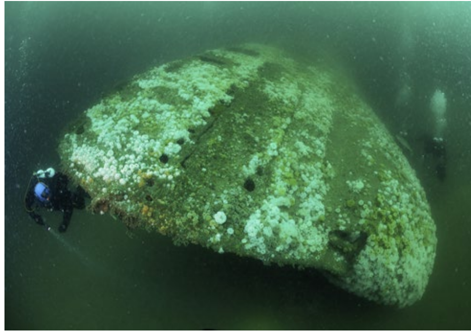
Boeg van de Russische onderzeeër op stuurboordzijde.

Op de Noordzeebodem liggen veel vissersschepen, kustschepen, oorlogsschepen, bevoorradingsschepen en booreilanden. Ze zijn begroeid als kunstmatige riffen. Een aparte categorie vormen de onderzeeboten. De oudste stammen uit de Eerste Wereldoorlog en verkeren door hun sterke constructie vaak nog in opmerkelijk goede staat. Alleen al de Royal Navy verloor in deze oorlog 56 duikboten. Door de drukcabine en hun ronde vorm hebben ze het al meer dan een eeuw uitgehouden. De gemiddelde levensduur van oppervlakteschepen bedraagt zo'n 80 jaar. Daarna blijven alleen de ketels en stoommachine achter als zichtbaar bewijs van hun bestaan. Met Stichting Duik de Noordzee Schoon hebben we de afgelopen jaren op verschillende onderzeeërs gedoken. Uit een onderzoeksrapport over een te bouwen windmolenpark, blijkt dat er daar vermoedelijk een Engelse duikboot uit de Tweede Wereldoorlog op de bodem ligt met de toren omhoog. We besluiten dit tijdens de tiende DDNZS-expeditie te onderzoeken. Bevriende duikers geven ons een positie ten westen van de Bruine Bank, een zandbank halverwege de Nederlandse en Engelse kust.