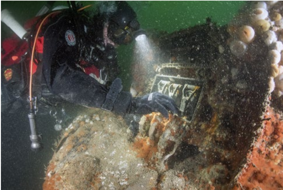
Schakelaars op de toren van de U-31, een Duitse duikboot die is gezonken in de Eerste Wereldoorlog.

VOOR DE INDOOR TRAINING HEBBEN WE DE VOLGENDE DATA: 3, 31 MAART, 14, 20 APRIL EN 12 MEI.