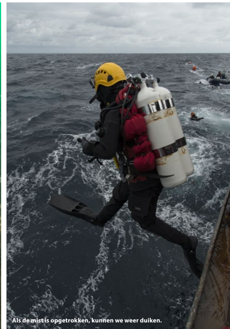
Als de mist is opgetrokken, kunnen we weer duiken.

S Ochtends verzamelen we ons na het ontbijt op het dek. Onze handige jongens zijn zoals altijd bezig met het optimaliseren van 101 praktische zaken, zoals het zeevast zetten van duiksets op de nieuwe banken. Een groepje techneuten sleutelt aan de compressor. Onze technische duikploeg heeft zich door de jaren heen tot een steeds hoger niveau ontwikkeld. Er staat een golfhoogte van anderhalve meter en de zon laat zich af en toe zien. Niet alle 30 deelnemers zijn al gewend aan de deining van het expeditiechip en lopen te geeuwen of zien een beetje groen. Het eerste teken van een naderende zeeziekte. De weersvoorspellingen voor de eerste drie dagen; windkracht 6 tot 7 en een golfhoogte van 2 tot 3 meter. We zullen het niet cadeau gaan krijgen en offers moeten maken om onze missie tot een goed einde te brengen.