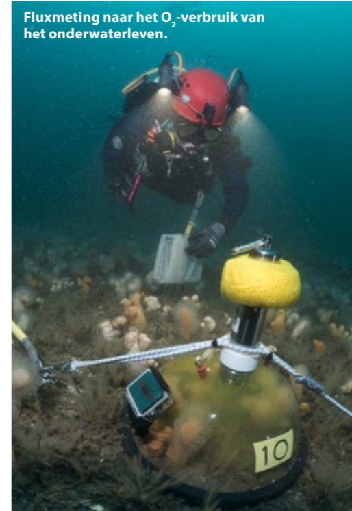
Fluxmeting naar het O 2 -verbruik van het onderwaterleven.

de Noordzee. Een onderzeeboot uit de Tweede Wereldoorlog ziet er na 79 jaar op de bodem natuurlijk anders uit dan tijdens het varen. De beschermende beplating waar de leidingen en afsluiters achter zitten, is weggeroest en alleen de drukhuid is een sterke cilinder die zelfs na 100 jaar nog helemaal intact kan zijn. We willen hier graag een onderzeeboot in zien, maar ik heb zo mijn twijfels. De drone zwemt verder naar voren en nu krijgen we de boeg in beeld. Dit lijkt wel een grote zaagtand. Veel onderzeeboten werden hiermee uitgerust om zichzelf uit de netten te zagen die als hindernissen werden opgehangen bij vijandelijke havens en doorgangen. Zou het dan toch? Tijdens het avondeten is de stemming euforisch; zouden we dan op de vijfde dag van deze expeditie de O13 hebben gevonden? De bouwtekeningen worden tevoorschijn gehaald zodat we morgen bij de duik precies weten waar we op moeten letten. Ik droom deze nacht natuurlijk over de bijzondere ontdekking die we morgen zullen gaan doen. Als ik 's morgens uit de patrijspoort kijk, is het mij snel duidelijk. Deze mist zit niet in mijn hoofd maar hangt buiten boven het relatief koude zeewater. Dat wordt geen duik met het gehele team. We vergaderen met het bestuur en we besluiten één team te laten duiken om opheldering over dit wrak te geven en het dregankertje op te