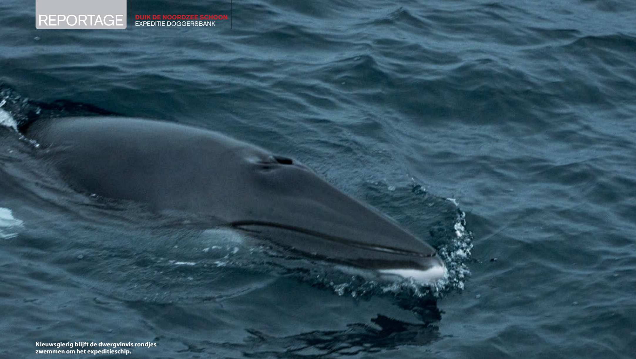
Nieuwsgierig blijft de dwergvinvis rondjes zwemmen om het expeditie-schip.