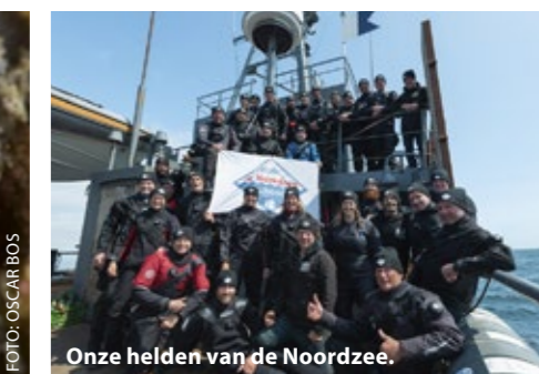
Onze helden van de Noordzee.

begroeid recht op de bodem klaarstaat om zo weer weg te varen. Welke ramp heeft zich hier voltrokken? Wat zal er met de stoere en hardwerkende vissers zijn gebeurd? Hebben zij het overleefd? Bij iedere duik krijgen we nieuwe vragen en heel soms vinden we een antwoord. We hebben deze expeditie 76 coördinaten van de vermoedelijke laatste rustplaats van de O13 onderzocht. De lijst van honderden puntjes hebben we hiermee aanzienlijk korter gemaakt. De volgende expeditie gaan we verder, net zolang totdat de O13 gevonden wordt. We hebben 600 kilo veelal staandwantnetten aan wal gebracht, met een totale lengte van enkele kilometers.