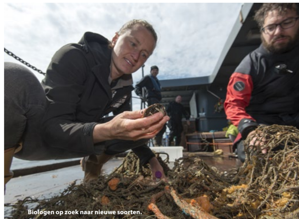
Biologen op zoek naar nieuwe soorten.

liggen. Helaas toont de sonar kleine objecten. Bij het derde puntje is het raak. We zien een object van ongeveer 80 meter lang. Het is nu zaak snel het water in te komen, want de kentering is al begonnen en op deze locatie in de Noordzee stroomt het aardig. De duikteams springen in groepen overboord en laten zich naar