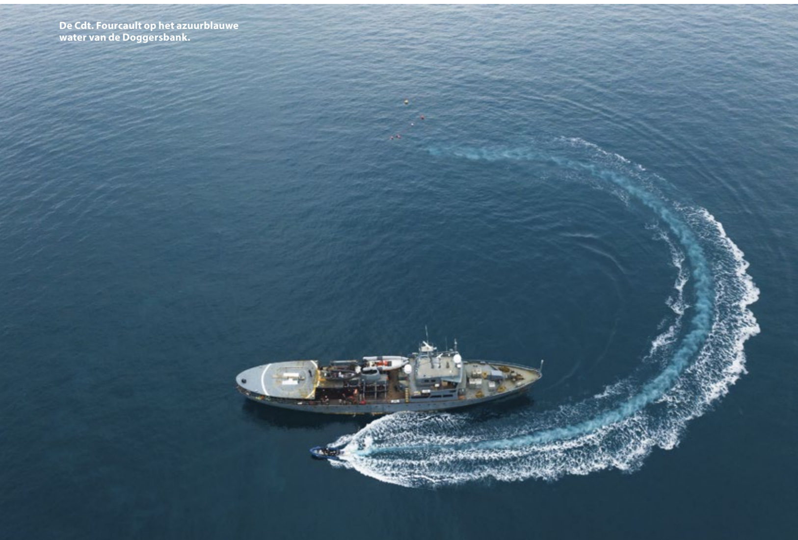
De Cdt. Fourcault op het azuurblauwe water van de Doggersbank.