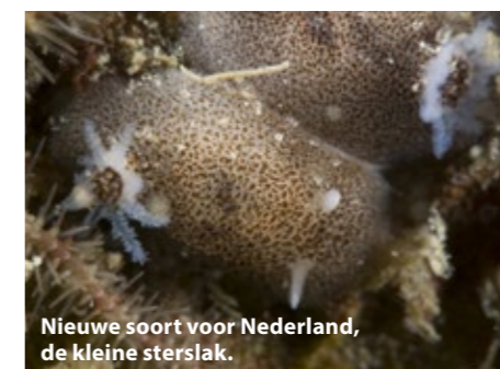
Nieuwe soort voor Nederland, de kleine sterkslak.

Ik maak in totaal 18 duiken op oude vracht en vissersschepen. Bijzonder is mijn duik op twee enorme pontons midden op de Doggersbank. Hoe zijn ze hier terechtgekomen en waar zijn ze voor gebruikt? Wraknummer 4137 is een onbekend vissersschip, dat volledig