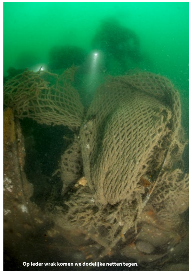
Op ieder wrak komen we dodelijke netten tegen.