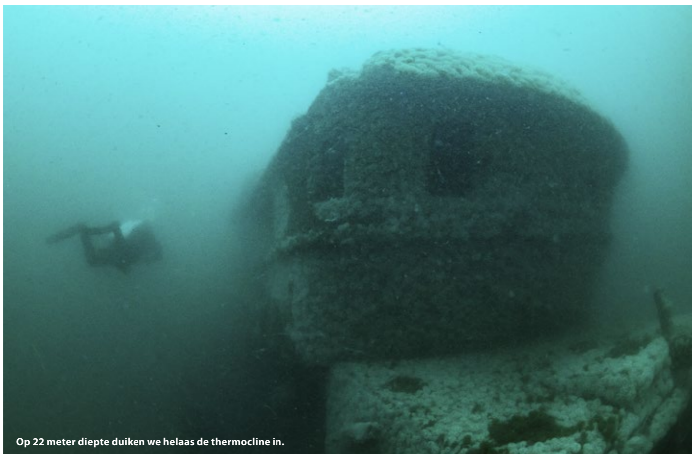
Op 22 meter diepte duiken we helaas de thermocline in.